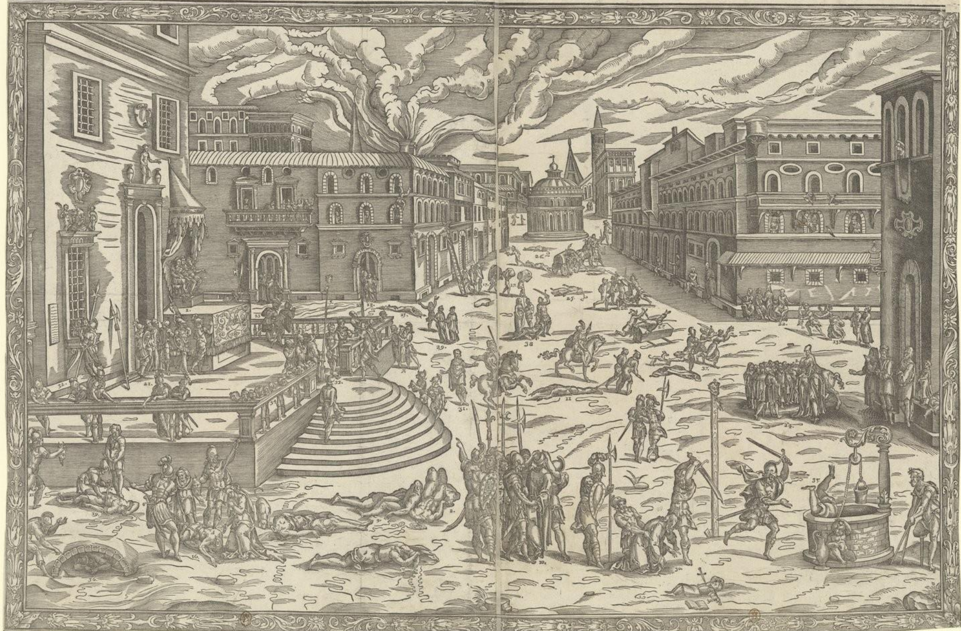
Gravure de Jean de Gourmont