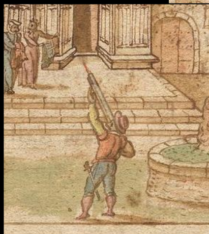
De Tristibus Galliae carmen, Manuscrit conservé à la Bibliothèque municipale de Lyon