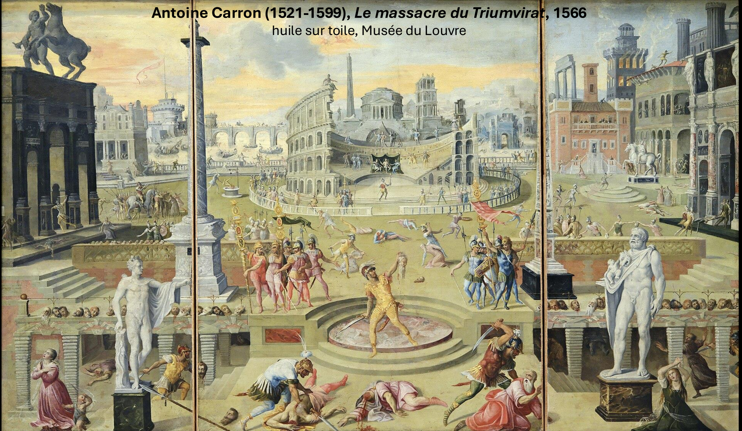
Antoine Carron (1521-1599), Le massacre du Triumvirat , 1566 huile sur toile, Musée du Louvre