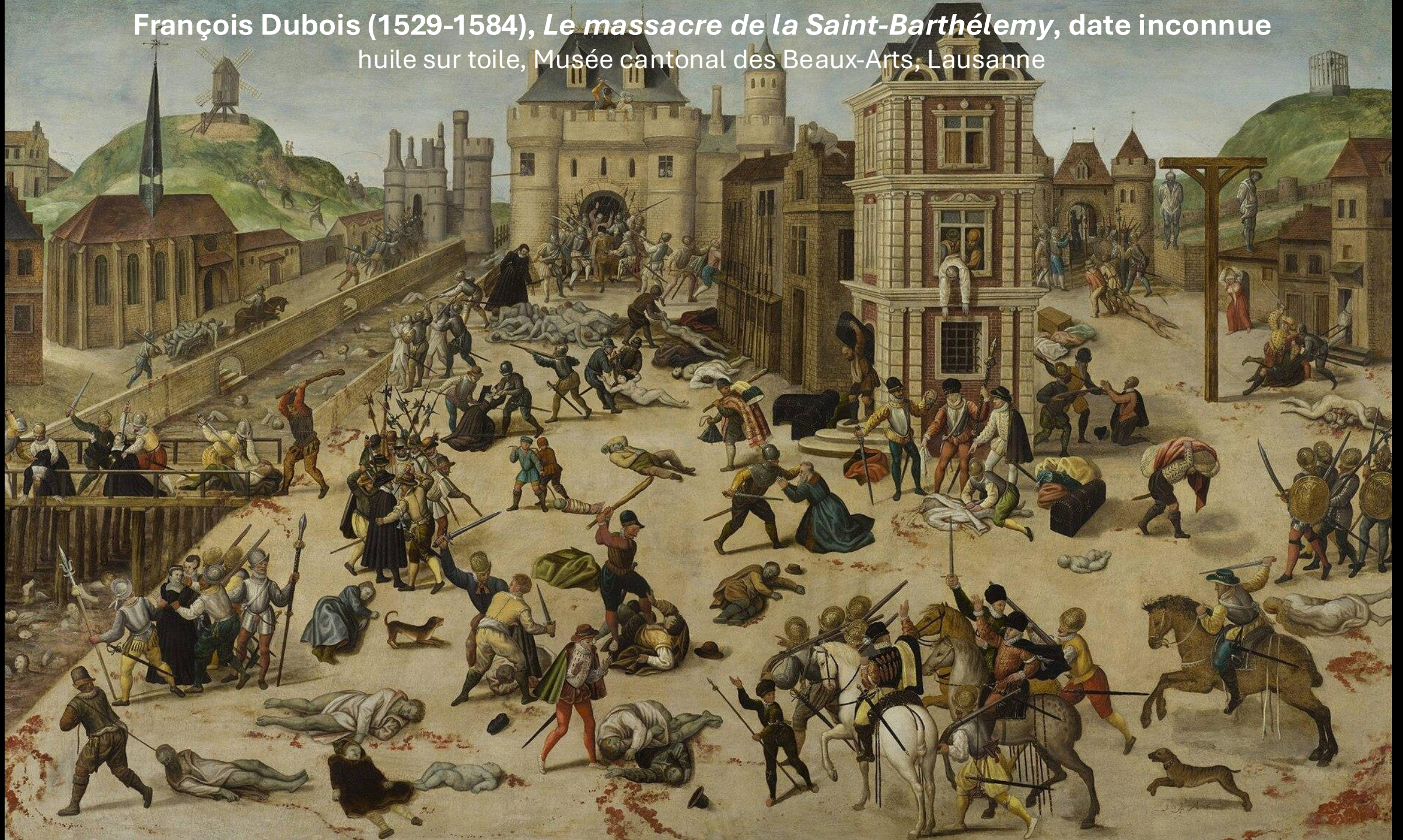
François Dubois (1529-1584), Le massacre de la Saint-Barthélemy , date inconnue huile sur toile, Musée cantonal des Beaux-Arts, Lausanne