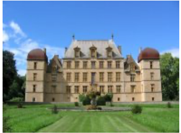
Le Château de Fléchères

Dans le prolongement de notre sortie du 17 mai dernier, « Lyon et le protestantisme », nous vous emmenons non loin de Genève, au nord de Lyon, à la découverte de trois lieux qui nous offrent une histoire du protestantisme originale et riche.