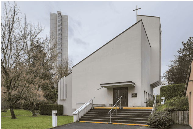
Le temple de Mâcon